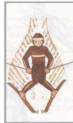
Торможени е «плугом»