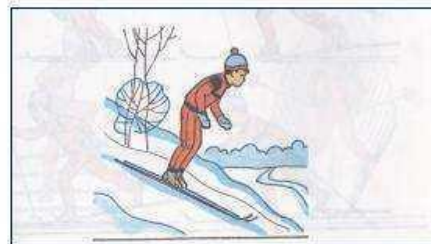
Спуски на лыжах