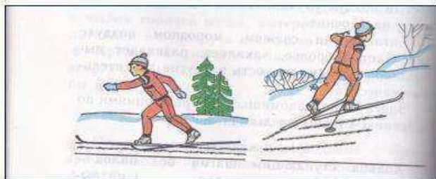
Скольз ящ ий шаг