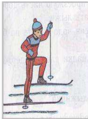
Подъ ем «лесенкой»