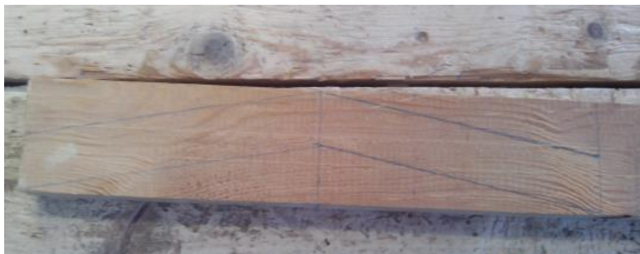
«Нанесённая на брусок разметка».

2. Ознакомьтесь с последовательностью выполнения заготовки.