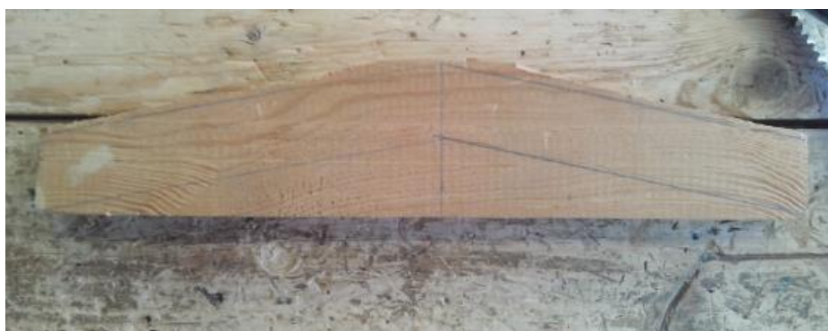
«Изделие с отпиленной верхней частью».

Сначала спиливаем верхние части, затем нижние.