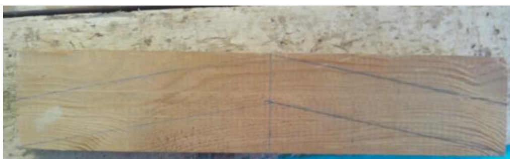
«Размеченная и отпиленная заготовка».

3. Убедитесь в правильности разметки с последующим отпиливанием заготовки по длине